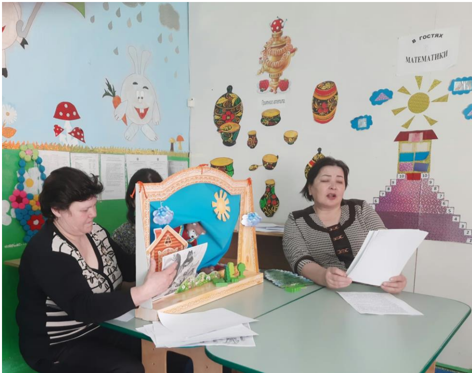
« Прощай наш детский сад»